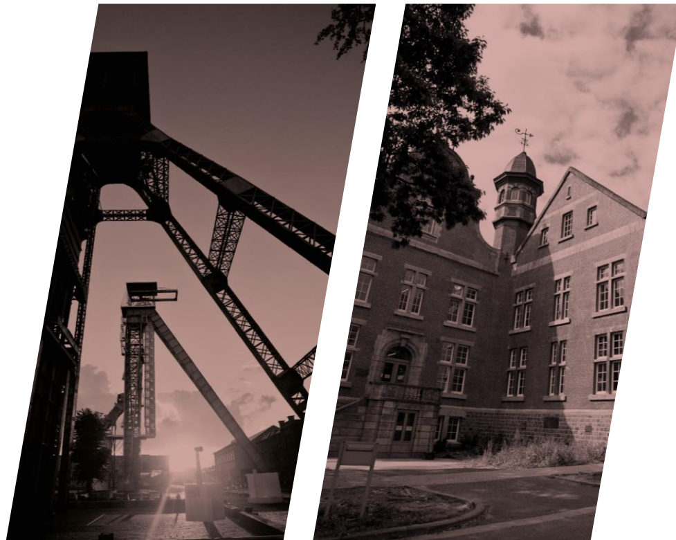
GENK – C-MINE CRIB